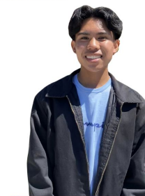
Christian Dotimas Impact Academy, Class of 2024

...a place where I feel cared for , a place where my skills are recognized and harnessed , a place that prepares me for the impact I will make on the world. ”