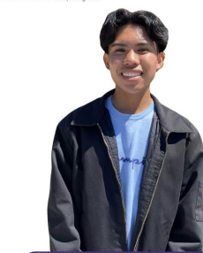
Christian Dotimas Impact Academy, Class of 2024

...a place where I feel cared for , a place where my skills are recognized and harnessed , a place that prepares me for the impact I will make on the world. ”